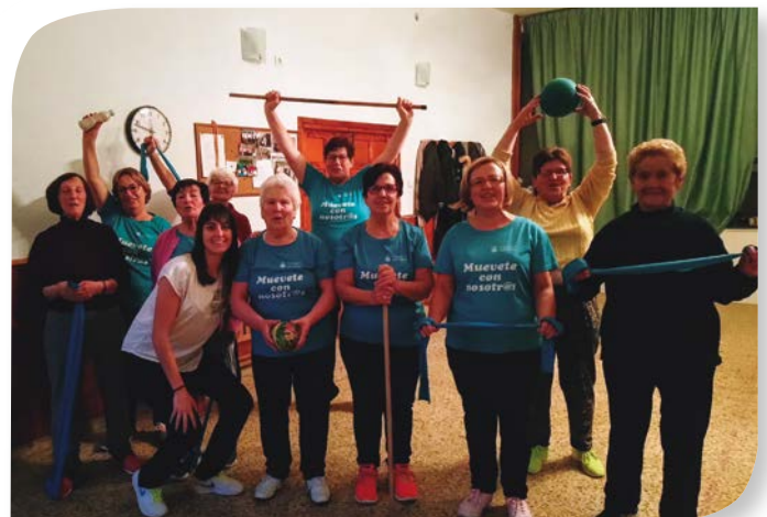
Asociación de Jubilados y Pensionistas CABAÑES ESGUEVA.