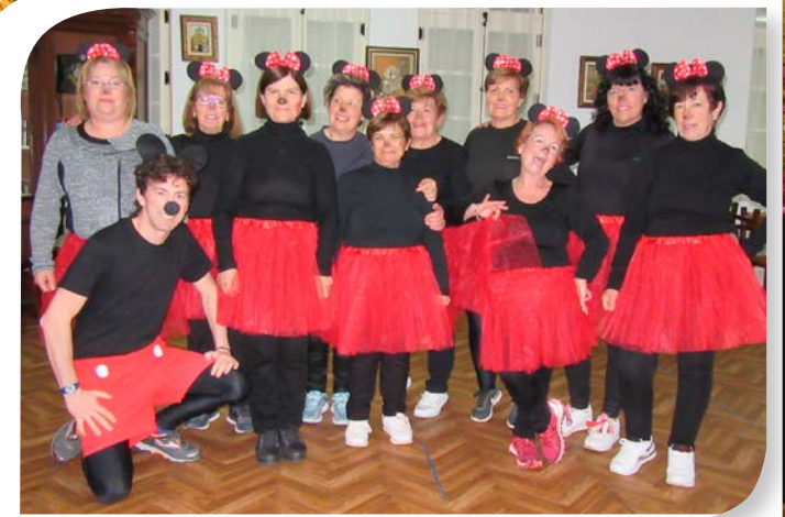
Asociación de Jubilados y Pensionistas FUENTEÑEBRO.