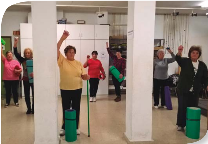
Asociación de Jubilados y Pensionistas SONCILLO.