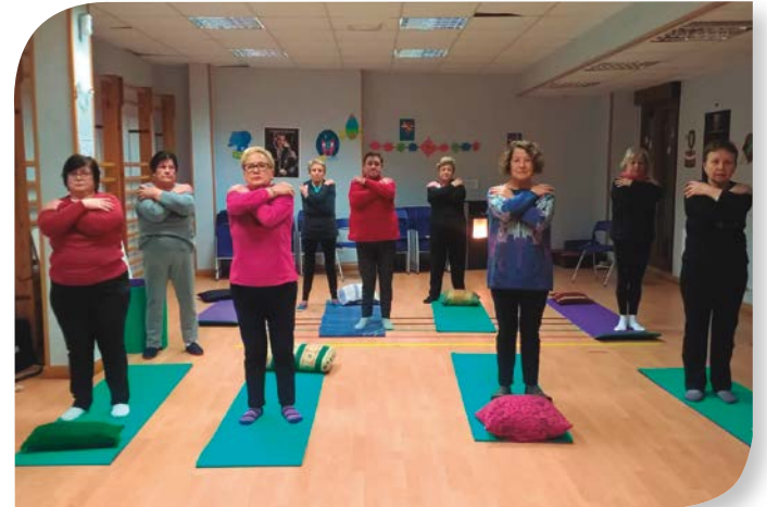
Asociación de Jubilados y Pensionistas POZA.