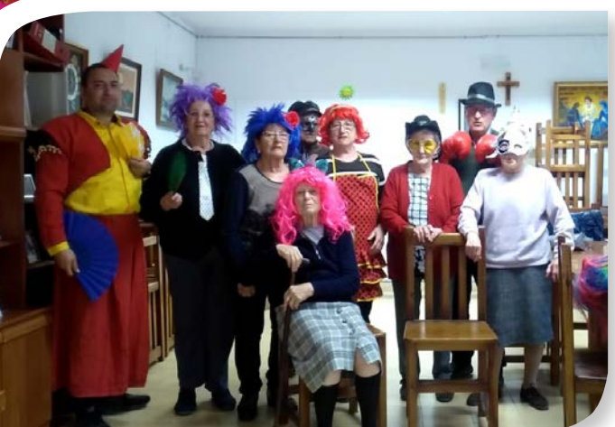
Asociación de Jubilados y Pensionistas QUINTANA DEL PIDIO.