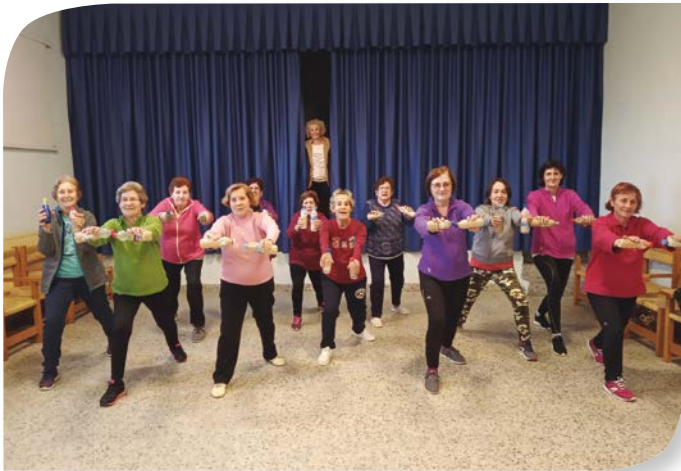
Asociación de Jubilados y Pensionistas PEDROSA DEL PRÍNCIPE.