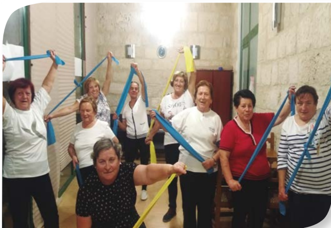
Asociación de Jubilados y Pensionistas UBIERNA.