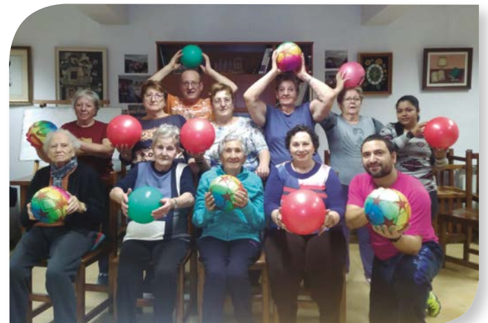
Asociación de Jubilados y Pensionistas QUINTANA DEL PIDIO.