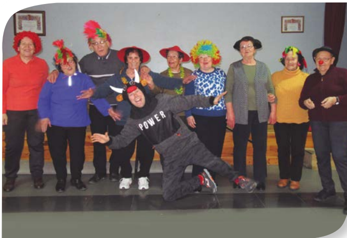
Asociación de Jubilados y Pensionistas CASTRILLO DE LA VEGA.