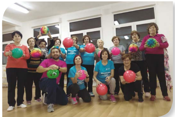
Asociación de Jubilados y Pensionistas PEÑARANDA DE DUERO.