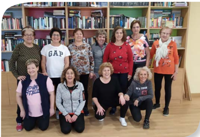
Asociación de Jubilados y Pensionistas LOS BALBASES.