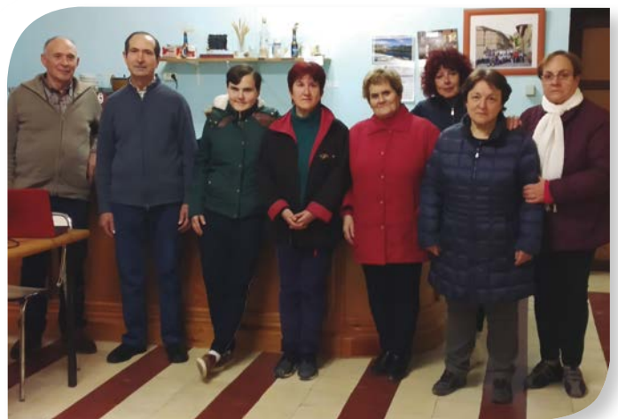
Asociación de Jubilados y Pensionistas PINILLA TRASMONTE.