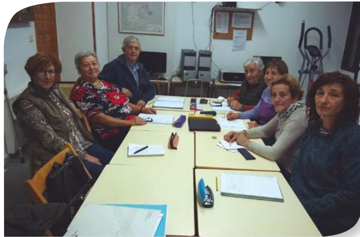
Asociación de Jubilados y Pensionistas QUINTANILLA DEL COCO.