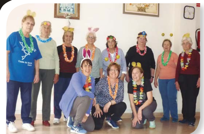
Asociación de Jubilados y Pensionistas HOYALES DE ROA.