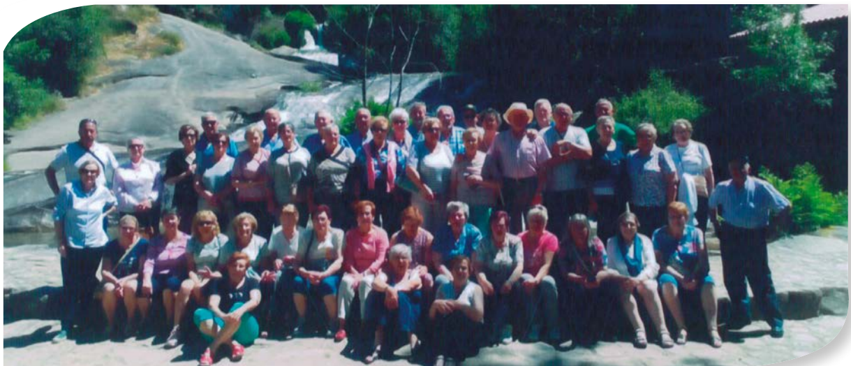
ASOCIACIÓN LAS TORRES MEDINA DE POMAR. EXCURSIÓN A GALICIA. CASCADA DE BAROJA.