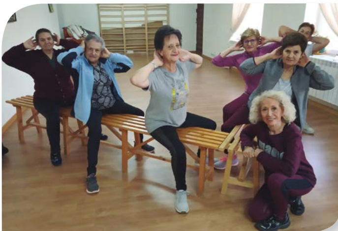
Asociación de Jubilados y Pensionistas PADILLA DE ABAJO.