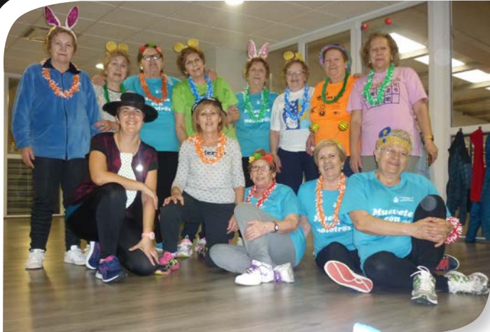
Asociación de Jubilados y Pensionistas ROA DE DUERO.