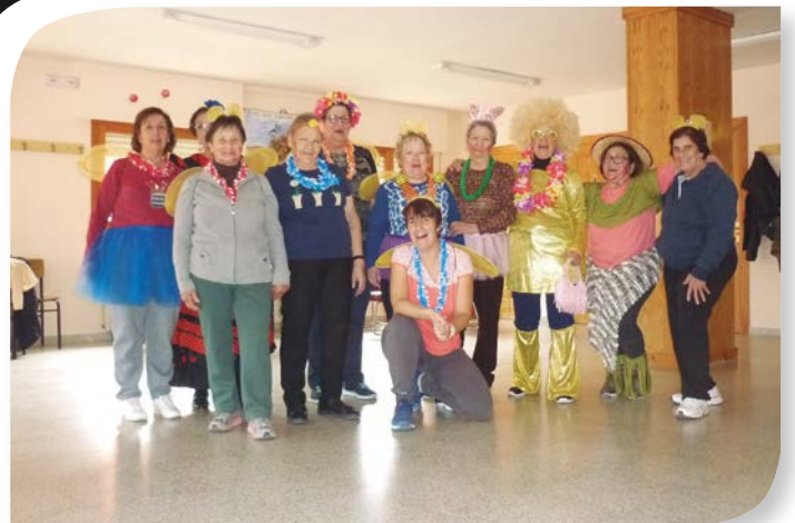
Asociación de Jubilados y Pensionistas CASTRILLO DE LA VEGA.