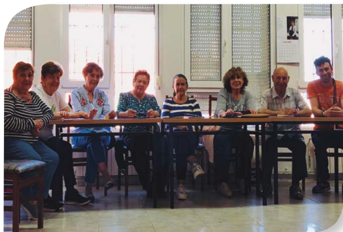
Asociación de Jubilados y Pensionistas OLMEDILLO DE ROA.