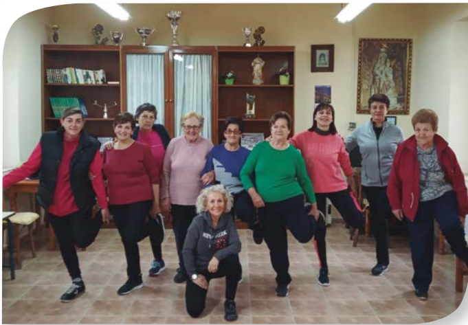
Asociación de Jubilados y Pensionistas GUADILLA DE VILLAMAR.