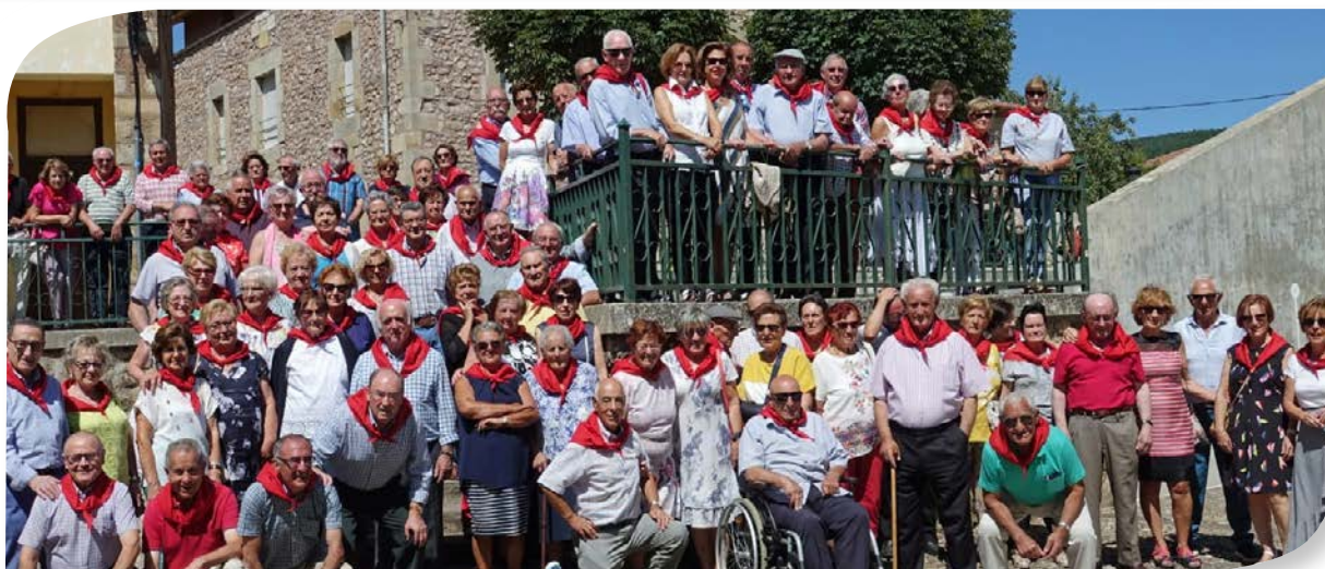
SEMANA CULTURAL DEL VALLE DE VALDELAGUNA.