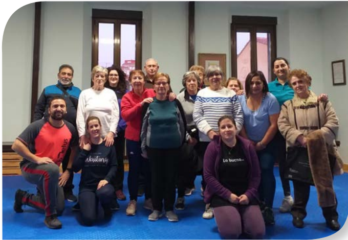
Asociación de Jubilados y Pensionistas HUERTA DEL REY.