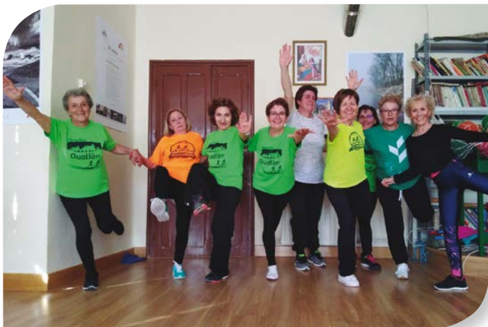
Asociación de Jubilados y Pensionistas VILLASANDINO.