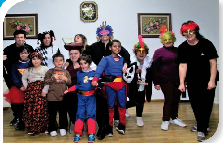
Asociación de Jubilados y Pensionistas VILLALBA DE DUERO.