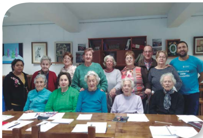
Asociación de Jubilados y Pensionistas QUINTANA DEL PIDIO.