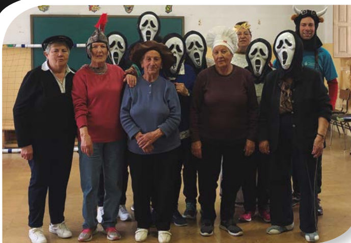
Asociación de Jubilados y Pensionistas TÓRTOLES DE ESGUEVA.