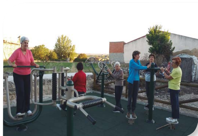
Asociación de Jubilados y Pensionistas VILLAZOPEQUE.