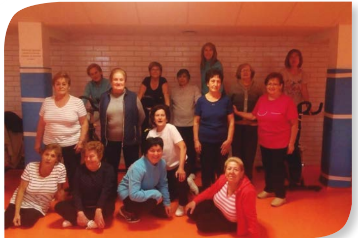
Asociación de Jubilados y Pensionistas ARCOS DE LA LLANA.