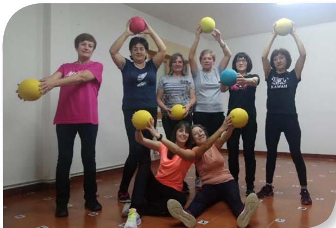
Asociación de Jubilados y Pensionistas SANTA CECILIA.