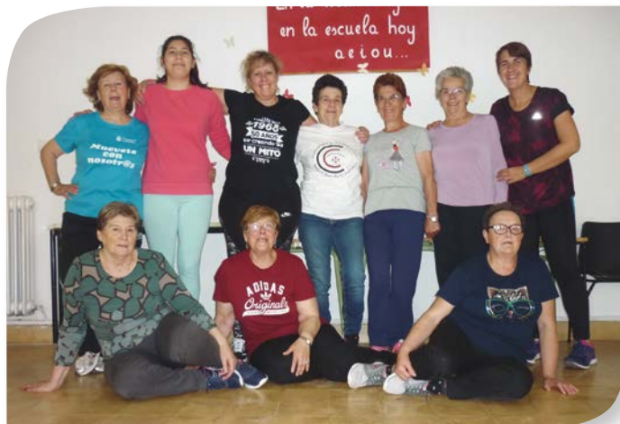
Asociación de Jubilados y Pensionistas SAN MARTÍN DE RUBIALES.