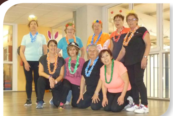
Asociación de Jubilados y Pensionistas ROA DE DUERO.