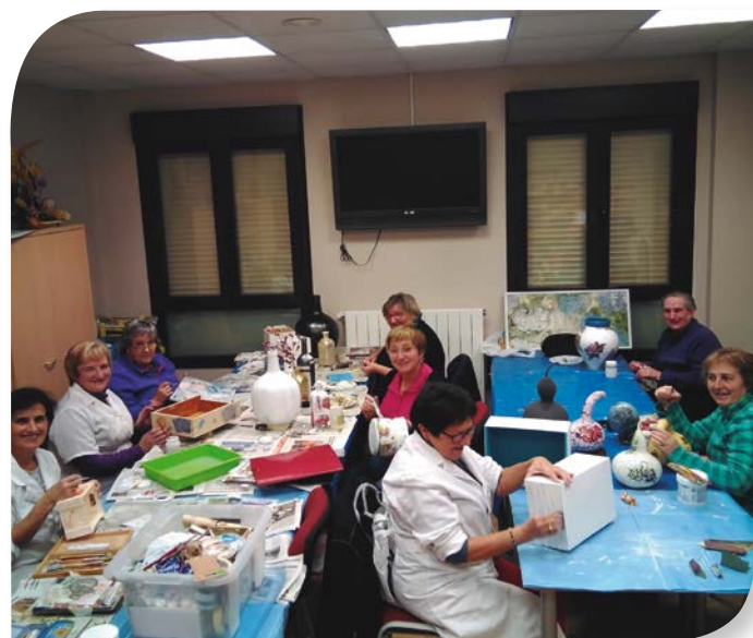
Asociación de Jubilados y Pensionistas REDECILLA DEL CAMINO.