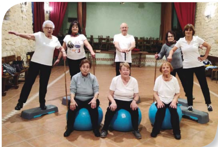
Asociación de Jubilados y Pensionistas SEDANO.