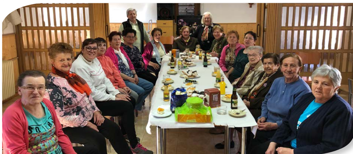
DESPEDIDA TÓRTOLES DE ESGUEVA.