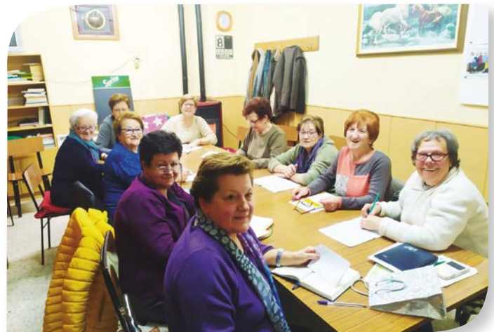
Asociación de Jubilados y Pensionistas CILLERUELO DE ABAJO.