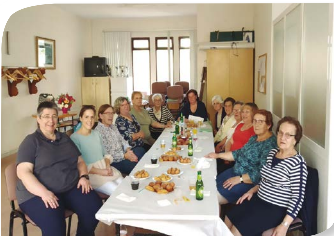
Asociación de Jubilados y Pensionistas HOYALES DE ROA.