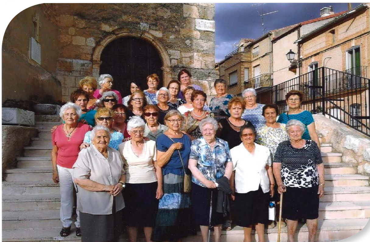
HOYALES DE ROA EN SU IGLESIA.