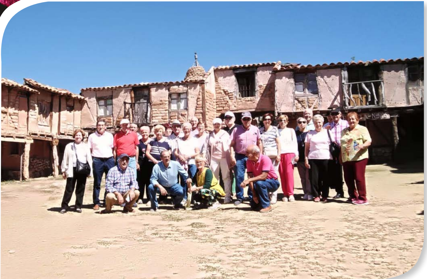
BARBADILLO DEL PEZ VISITA A TERRITORIO ARLANZA.