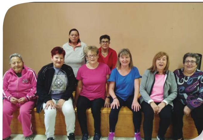
Asociación de Jubilados y Pensionistas SANTIBÁÑEZ ZARZAGUDA.