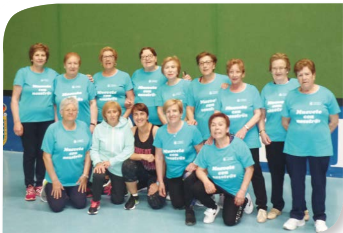
Asociación de Jubilados y Pensionistas ROA DE DUERO.