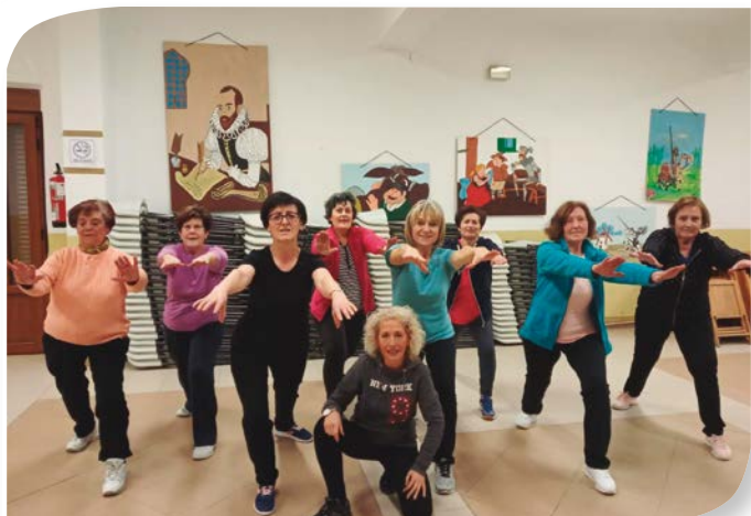
Asociación de Jubilados y Pensionistas CASTRILLO DE MURCIA.