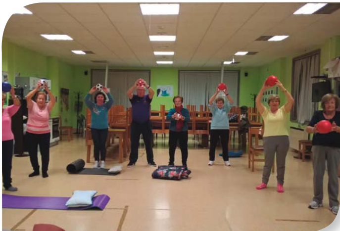
Asociación de Jubilados y Pensionistas MEDINA DE POMAR.