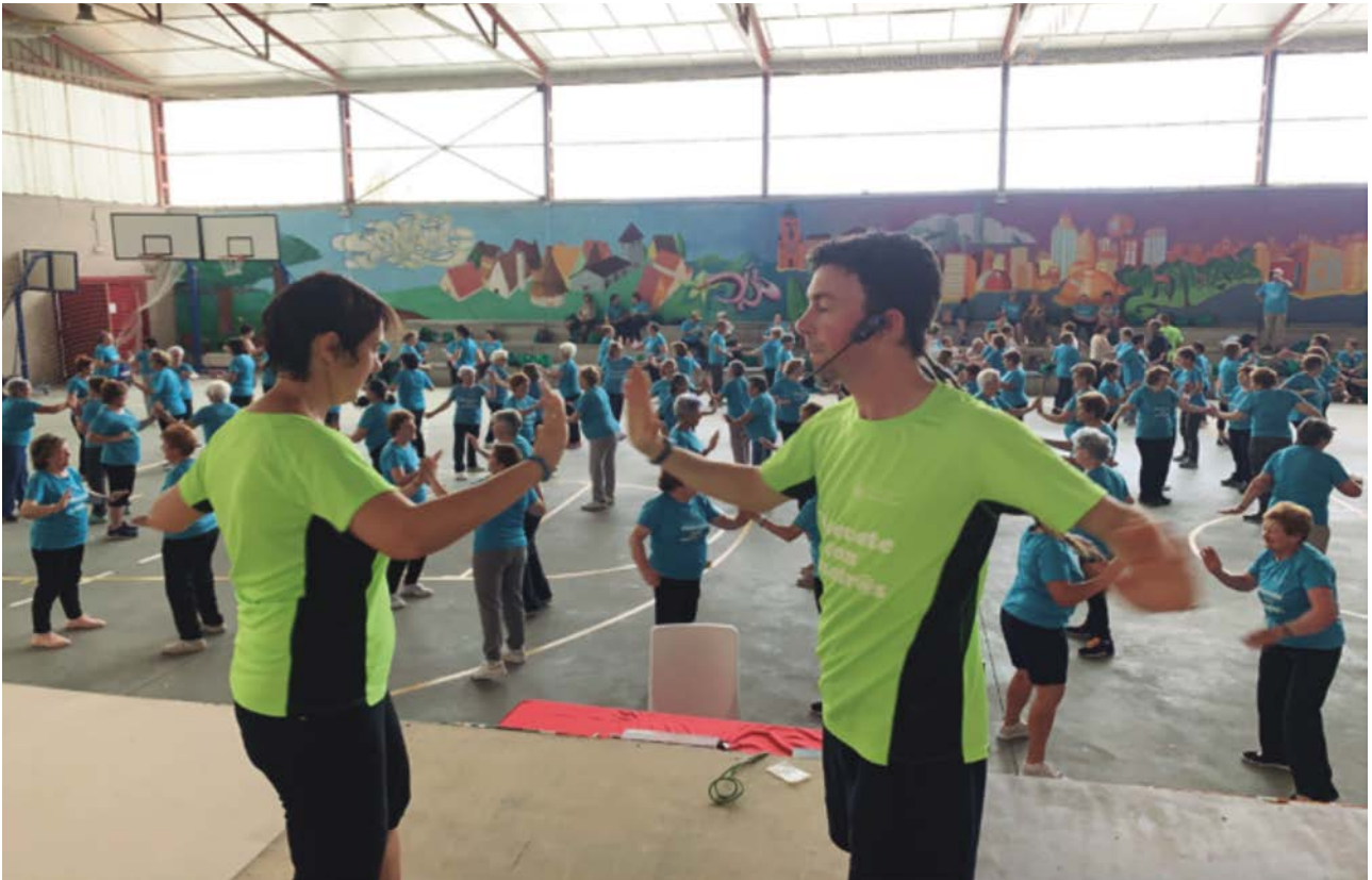
Después acabamos con una comida de hermandad y, por supuesto, más baile.

VIAJES ARANDA TOURS, S.A. TODO EN VIAJES