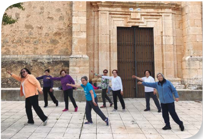
Asociación de Jubilados y Pensionistas FUENTELCÉSPED.