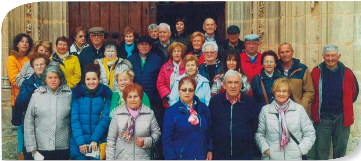
ASOCIACIÓN LAS TORRES MEDINA DE POMAR. EXCURSIÓN A LA CARTUJA DE BURGOS Y LAS EDADES DEL HOMBRE.