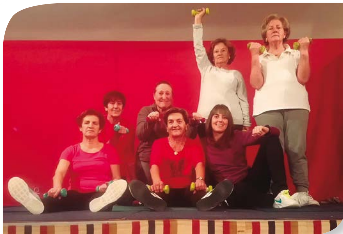
Asociación de Jubilados y Pensionistas MECERREYES.