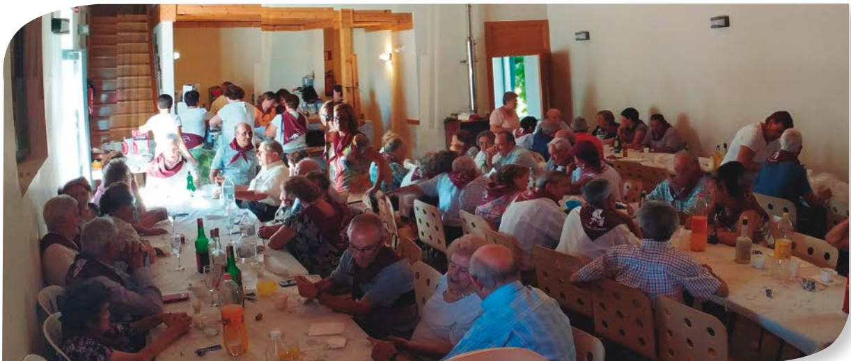
PINILLA TRASMONTE. COMIDA DE HERMANDAD.