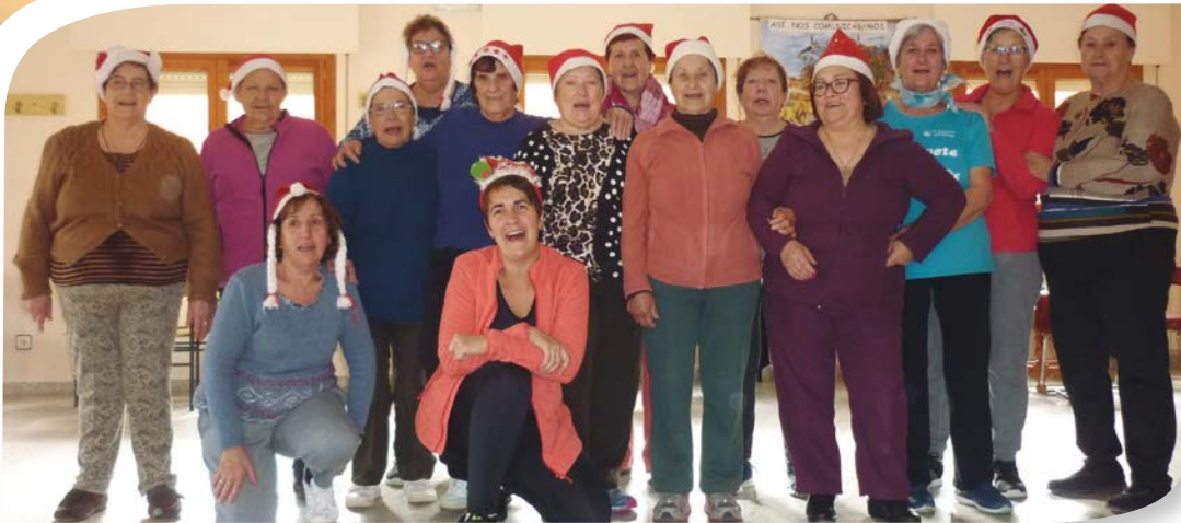
Asociación de Jubilados y Pensionistas CASTRILLO DE LA VEGA.