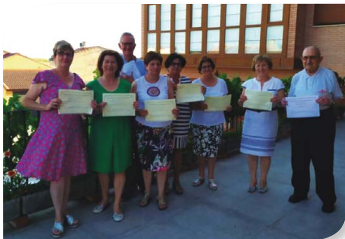
Asociación de Jubilados y Pensionistas LA HORRA.