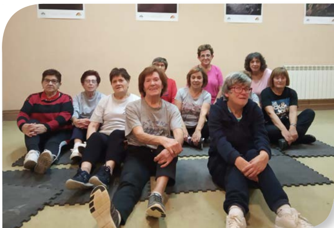
Asociación de Jubilados y Pensionistas VILLANUEVA ARGAÑO.