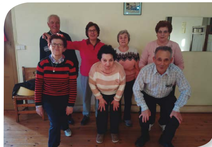
Asociación de Jubilados y Pensionistas SOLARANA.