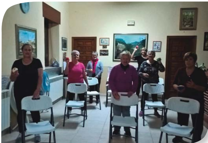
Asociación de Jubilados y Pensionistas PUENTE ARENAS.