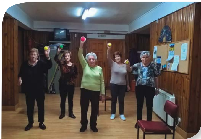
Asociación de Jubilados y Pensionistas FRÍAS.