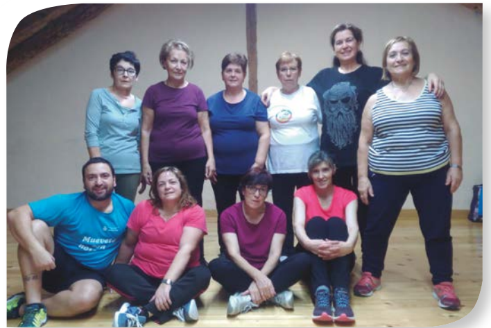
Asociación de Jubilados y Pensionistas GUMIEL DE IZÁN.