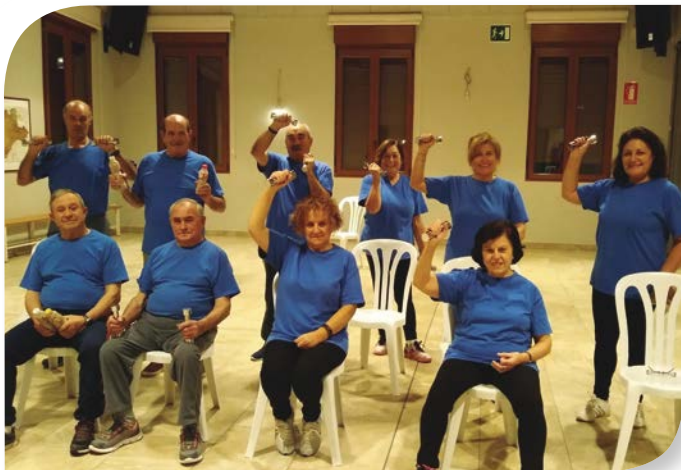
Asociación de Jubilados y Pensionistas LAS QUINTANILLAS.