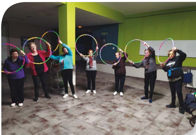
Asociación de Jubilados y Pensionistas BUSTO DE BUREBA.