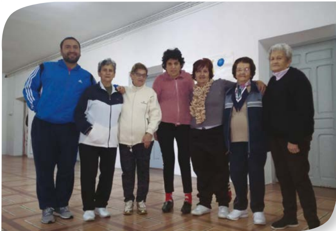
Asociación de Jubilados y Pensionistas ARAUZO DE MIEL.