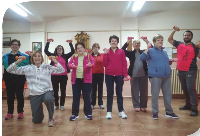
Asociación de Jubilados y Pensionistas ZAZUAR.