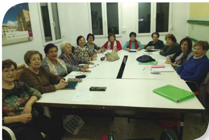
Asociación de Jubilados y Pensionistas PEÑARANDA DE DUERO.