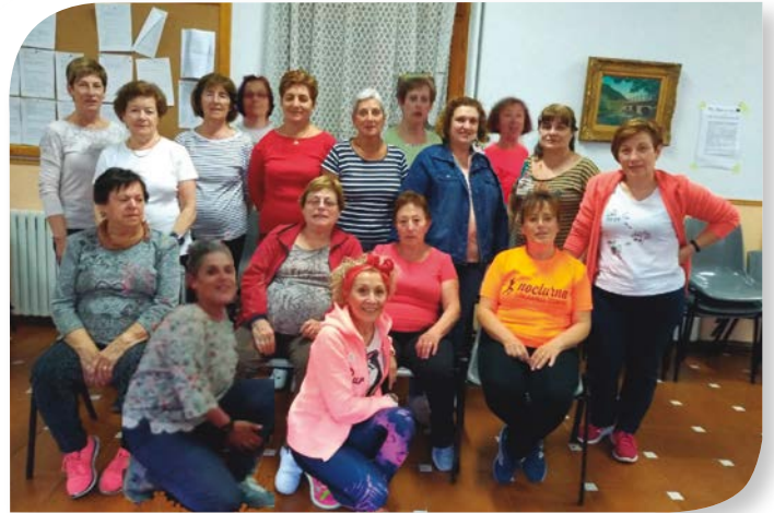
Asociación de Jubilados y Pensionistas TARDAJOS.