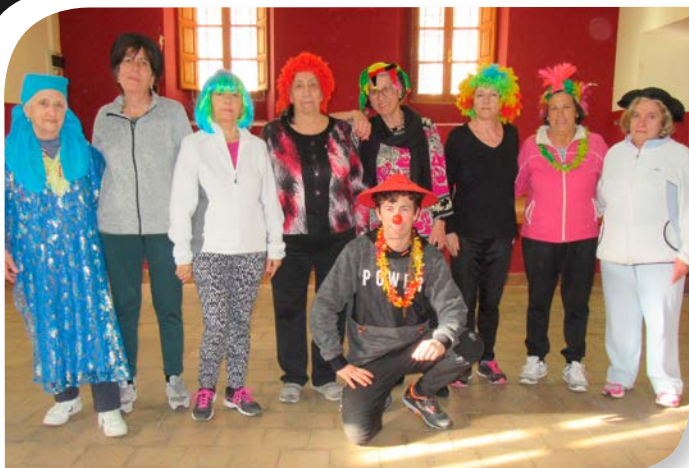
Asociación de Jubilados y Pensionistas SOTILLO DE LA RIBERA.