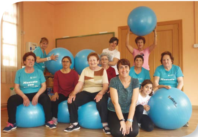
Asociación de Jubilados y Pensionistas BERLANGAS DE ROA.