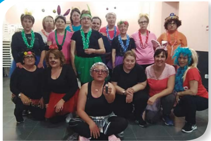
Asociación de Jubilados y Pensionistas LA HORRA.