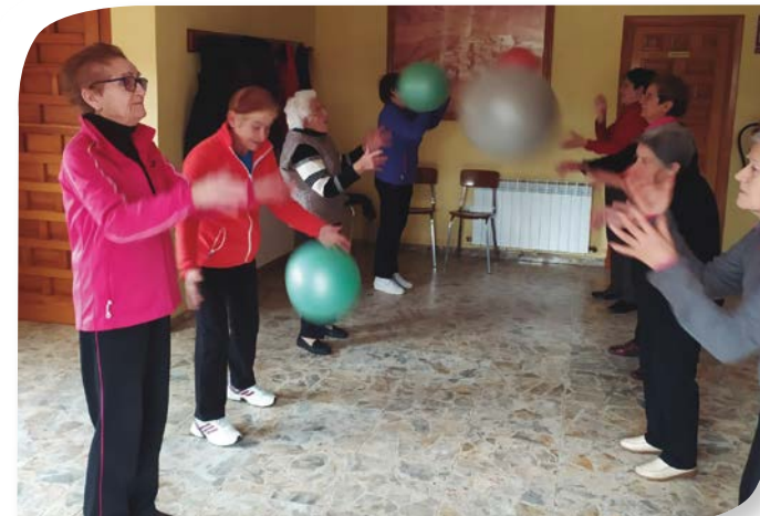
Asociación de Jubilados y Pensionistas NAVAS DE BUREBA.