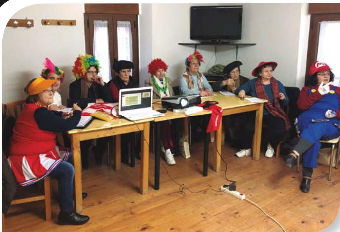
Asociación de Jubilados y Pensionistas FUENTELEÓN.