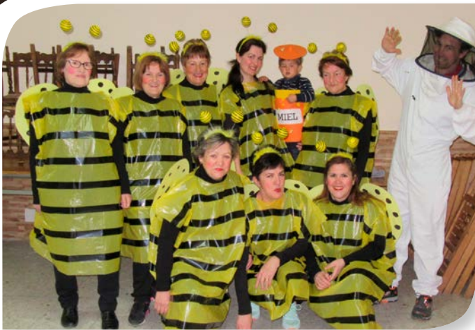
Asociación de Jubilados y Pensionistas LA AGUILERA.