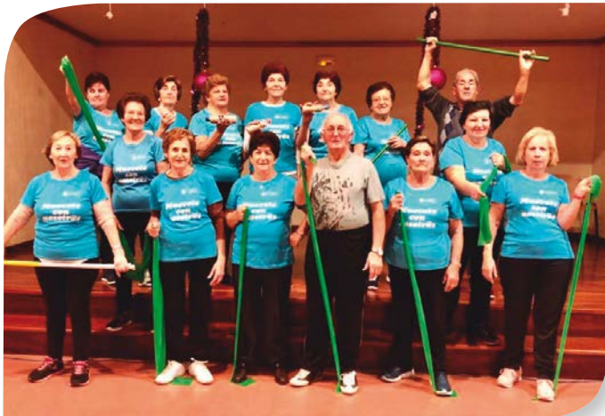
Asociación de Jubilados y Pensionistas TORRESANDINO.