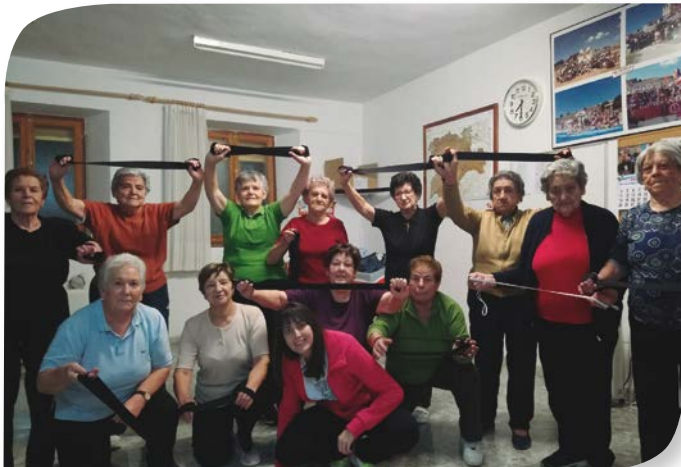
Asociación de Jubilados y Pensionistas PINEDA TRASMONTE.