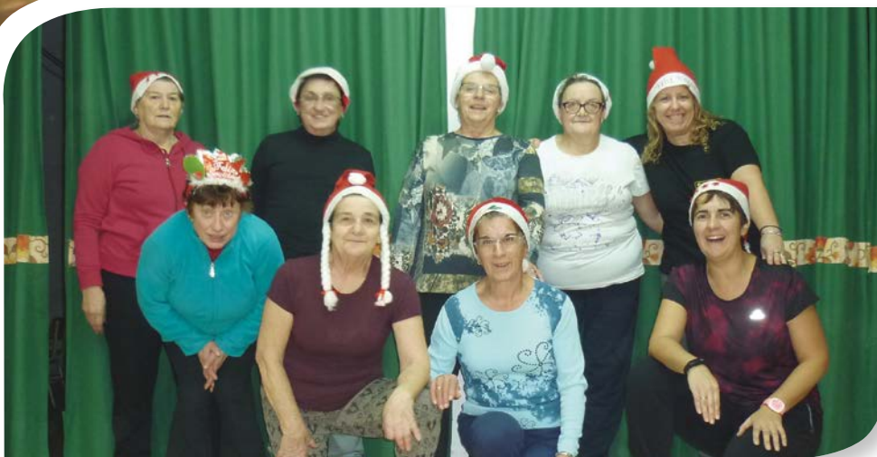
Asociación de Jubilados y Pensionistas SAN MARTÍN DE RUBIALES.