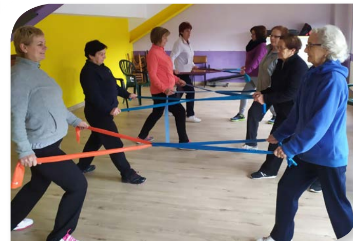
Asociación de Jubilados y Pensionistas PANCORBO.