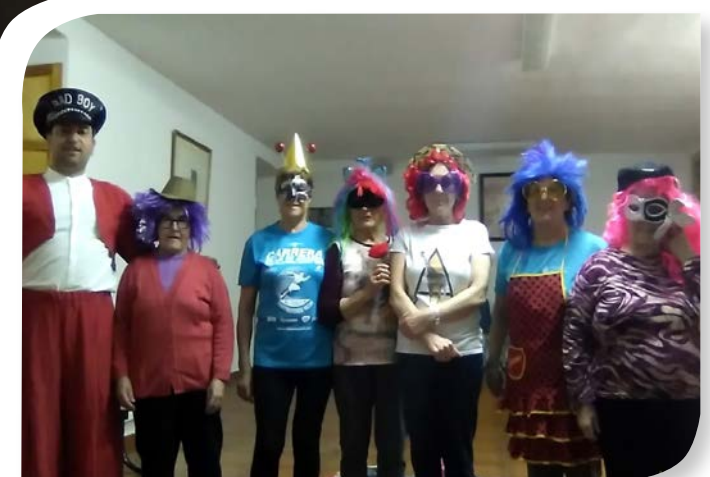
Asociación de Jubilados y Pensionistas VALDEANDE.