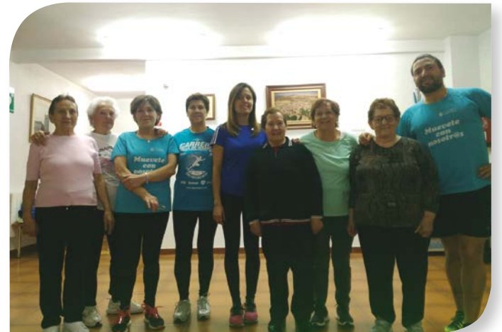
Asociación de Jubilados y Pensionistas VALDEANDE.