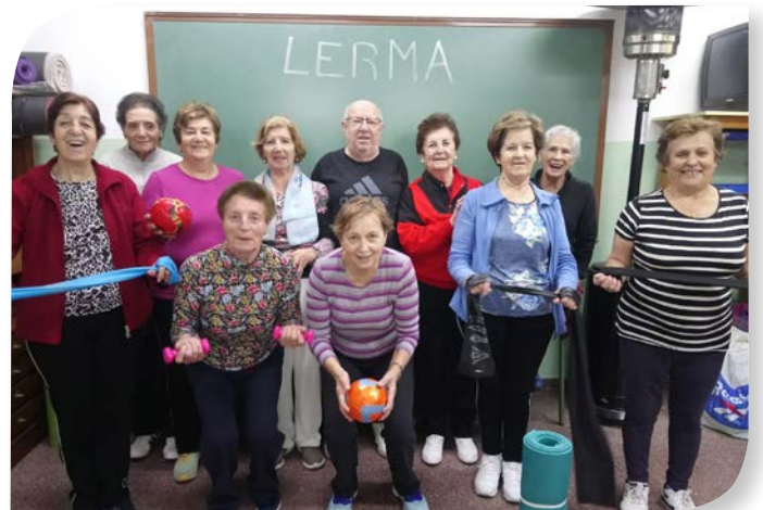
Asociación de Jubilados y Pensionistas LERMA.