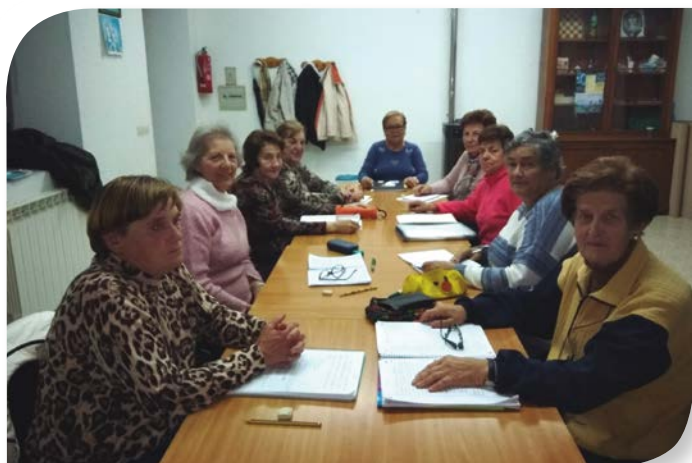
Asociación de Jubilados y Pensionistas MODÚBAR DE LA EMPAREDADA.