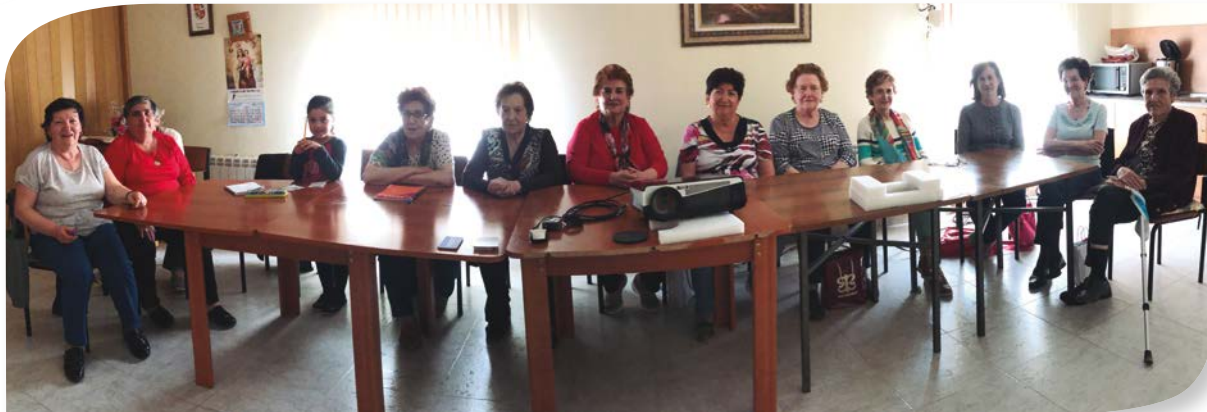
Asociación de Jubilados y Pensionistas TORRESANDINO.