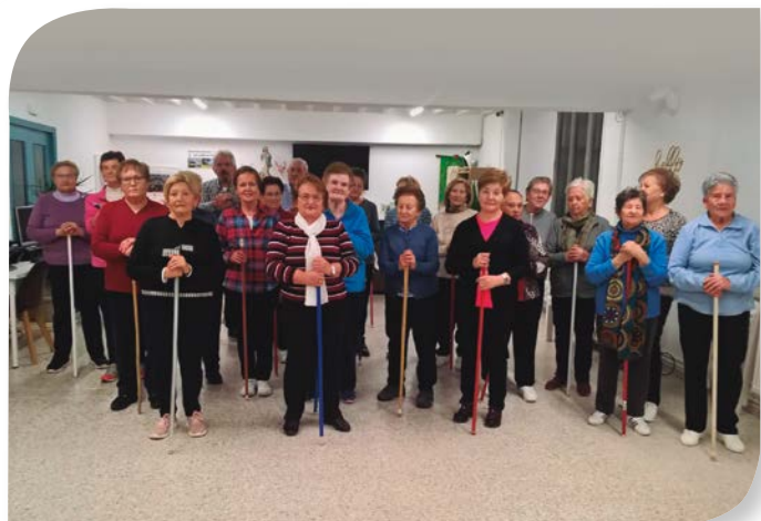
Asociación de Jubilados y Pensionistas VILLARCAYO.