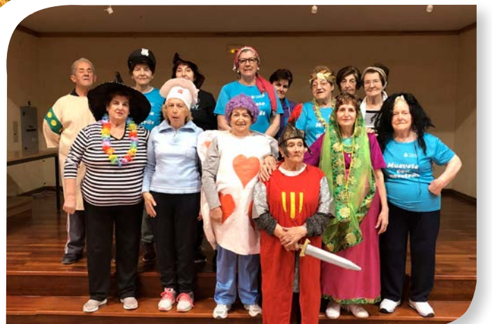
Asociación de Jubilados y Pensionistas TORRESANDINO.