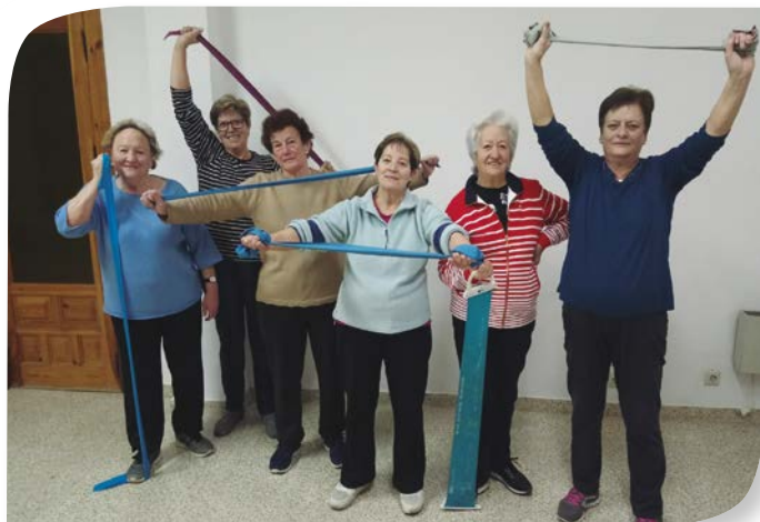
Asociación de Jubilados y Pensionistas CILLERUELO DE ABAJO.