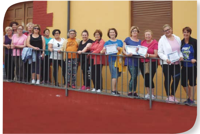
Asociación de Jubilados y Pensionistas LA HORRA.