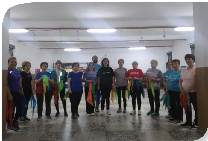
Asociación de Jubilados y Pensionistas VILLALBA DE DUERO.