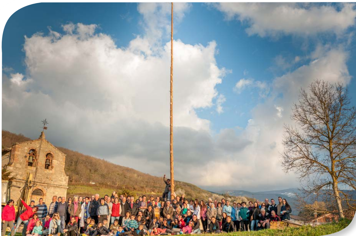
PINGADA DEL MAYO EN SANTA CRUZ DEL VALLE URBIÓN.