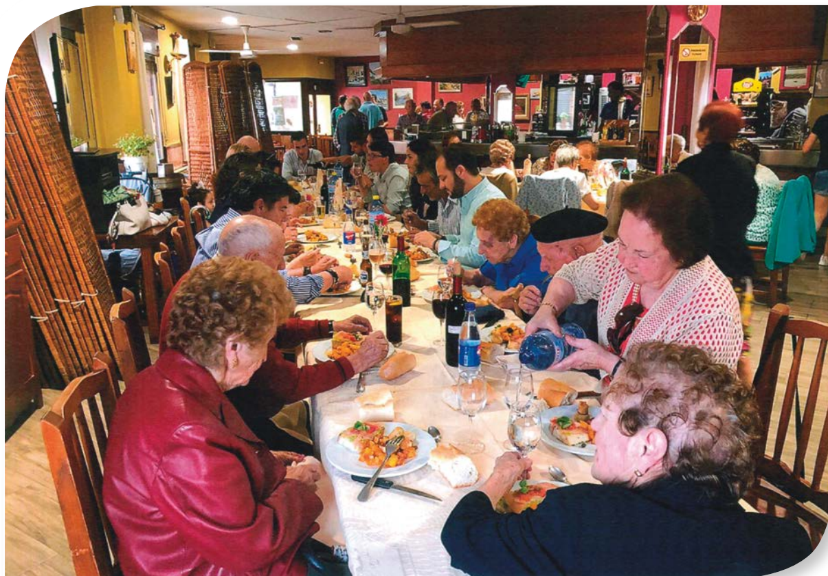
HONTORIA DEL PINAR.