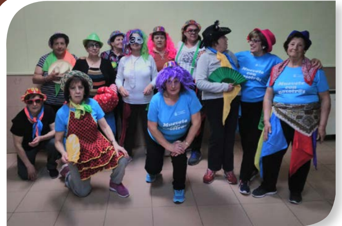
Asociación de Jubilados y Pensionistas PEÑARANDA DE DUERO.