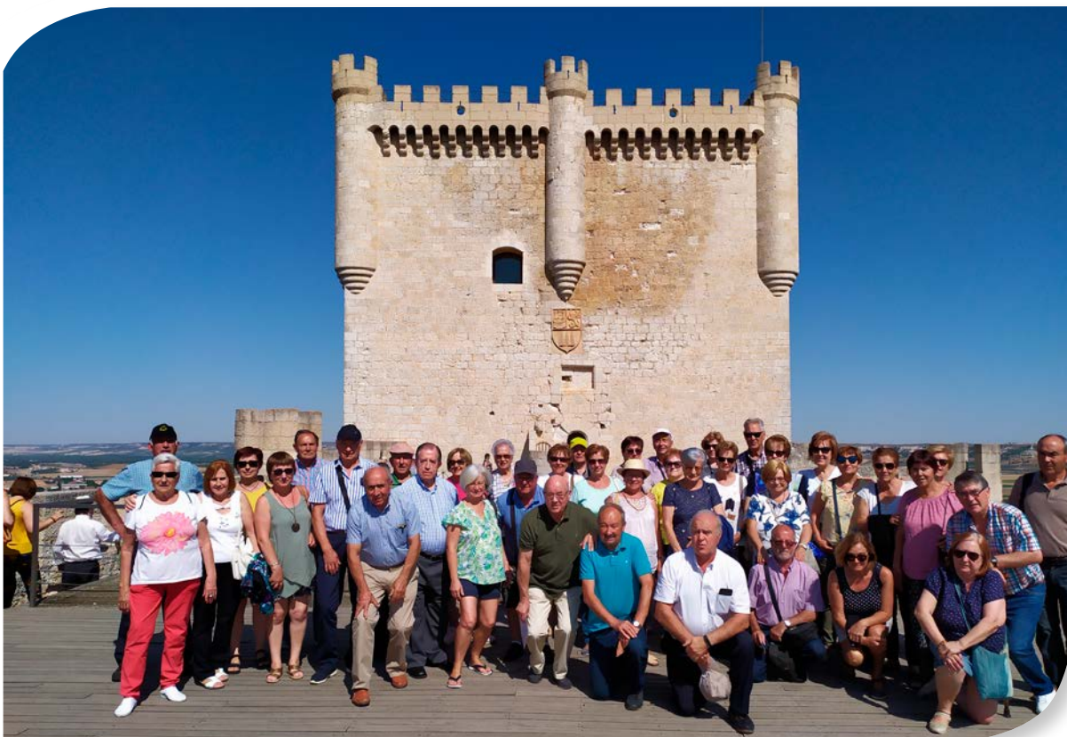
SEDANO. EXCURSION A PEÑAFIEL.