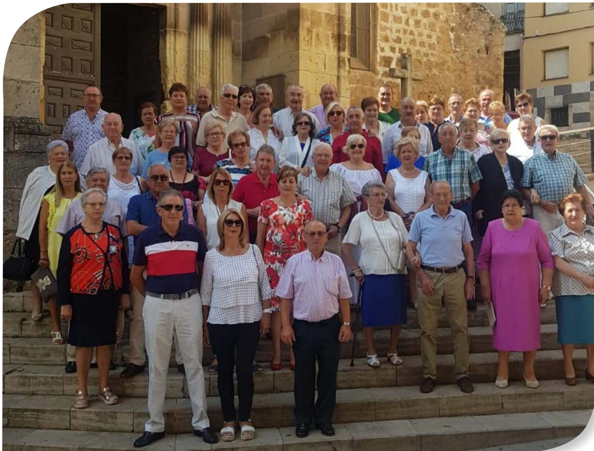
POZA DE LA SAL.IGLESIA DE SAN COSME Y SAN DAMIAN.