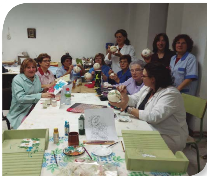
Asociación de Jubilados y Pensionistas GUMIEL DE IZÁN.