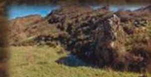
Ruinas San Pedro de Arceledo

Las estrellas y la luna hicieron un guiño. El cielo lloro, lloró y lloró, tanto que sus lágrimas al río Urbión desbordó. Así fue como el fuego se apagó.