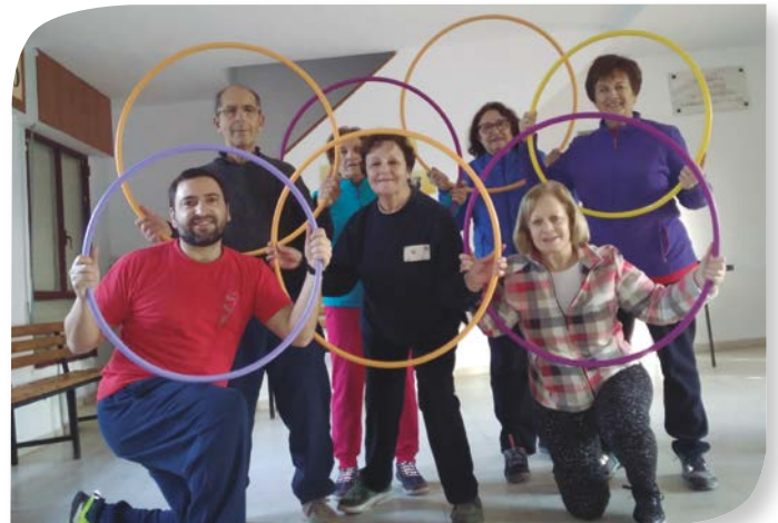
Asociación de Jubilados y Pensionistas BRAZACORTA.