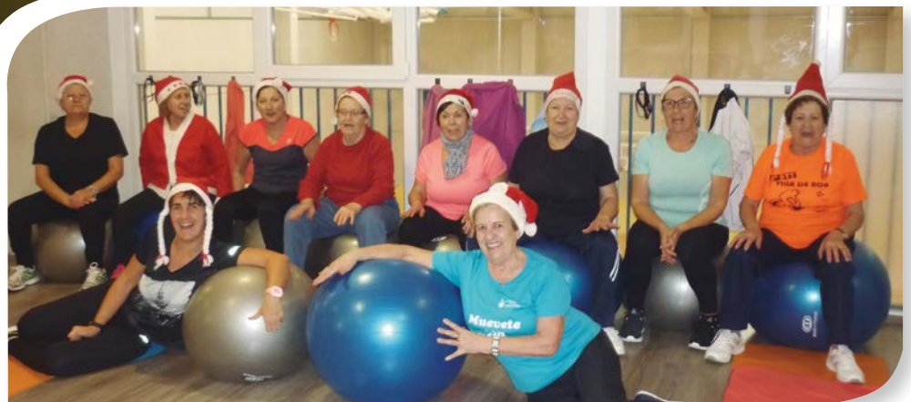
Asociación de Jubilados y Pensionistas ROA DE DUERO.