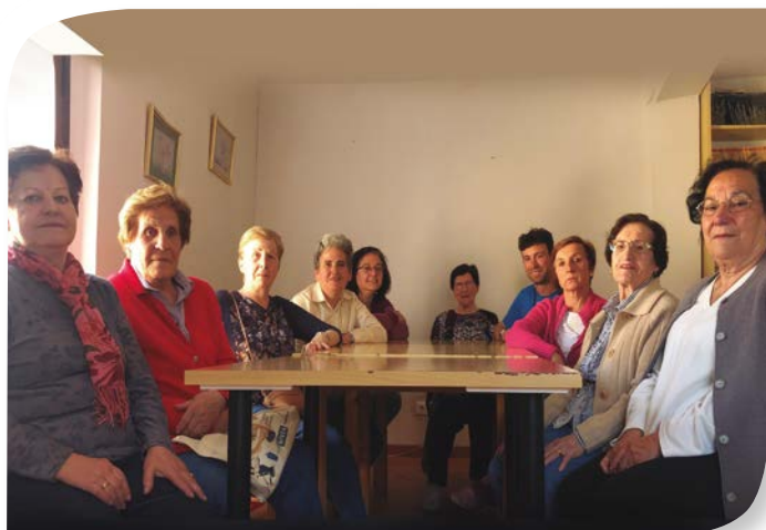
Asociación de Jubilados y Pensionistas FUENTELCÉSPED.