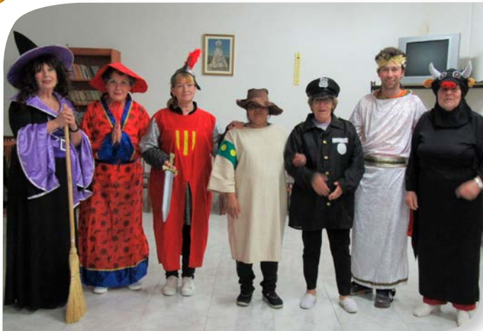
Asociación de Jubilados y Pensionistas OLMEDILLO DE ROA.