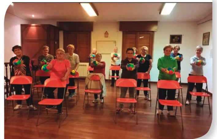
Asociación de Jubilados y Pensionistas TRESPADERNE.