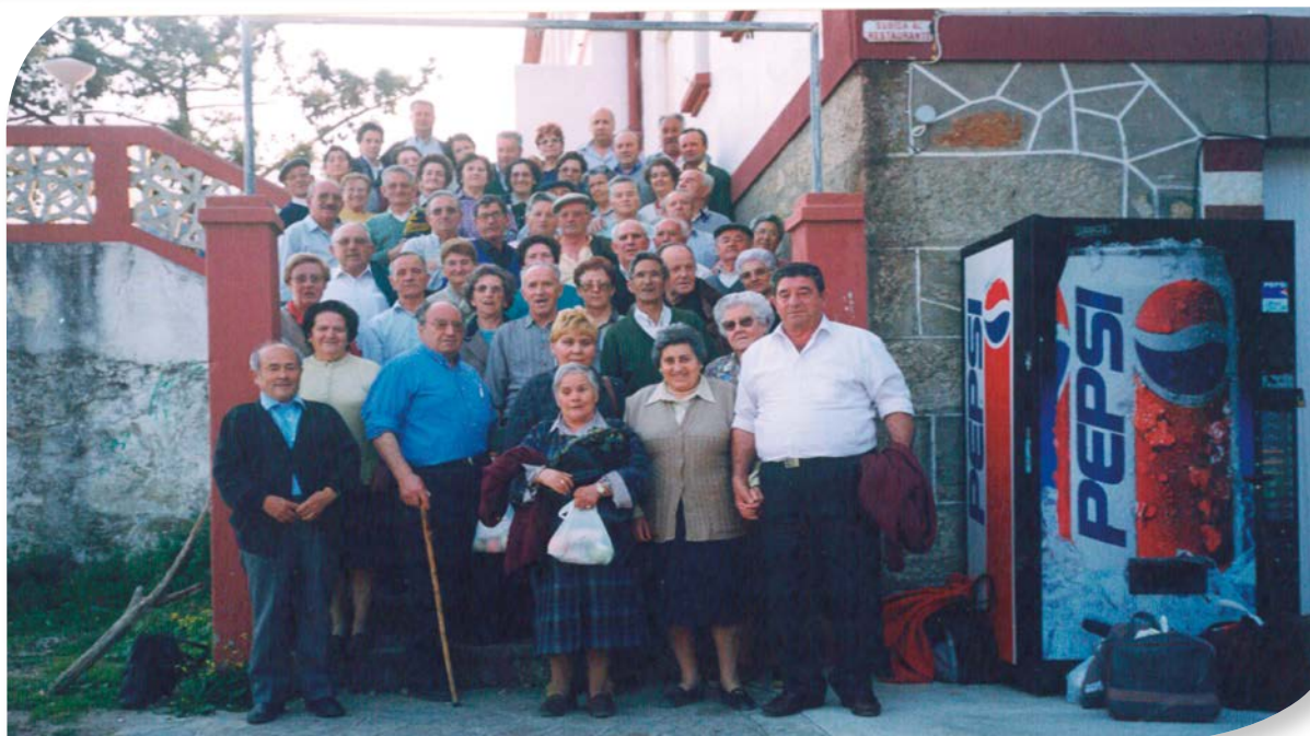
SAN MIGUEL PEDROSO.