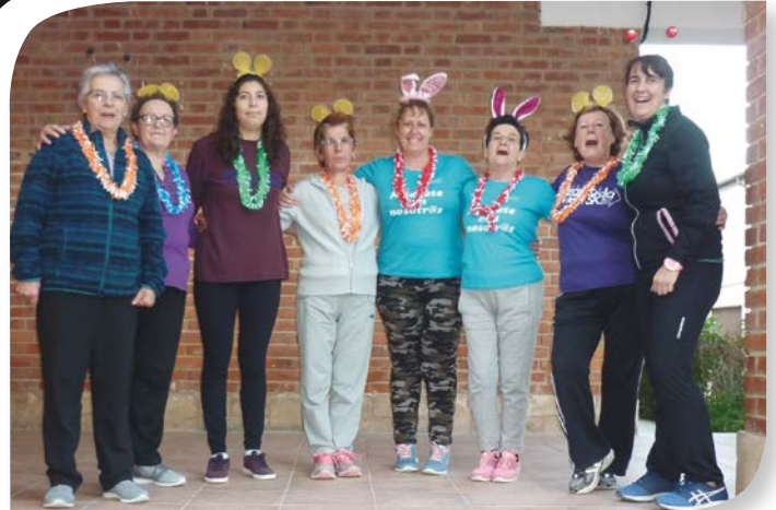
Asociación de Jubilados y Pensionistas SAN MARTÍN DE RUBIALES.