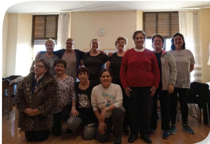
Asociación de Jubilados y Pensionistas CASTROJERIZ.