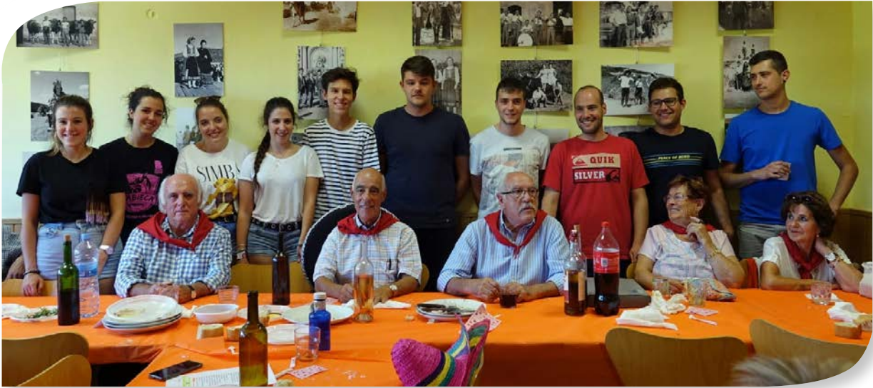
SEMANA CULTURAL DEL VALLE DE VALDELAGUNA.