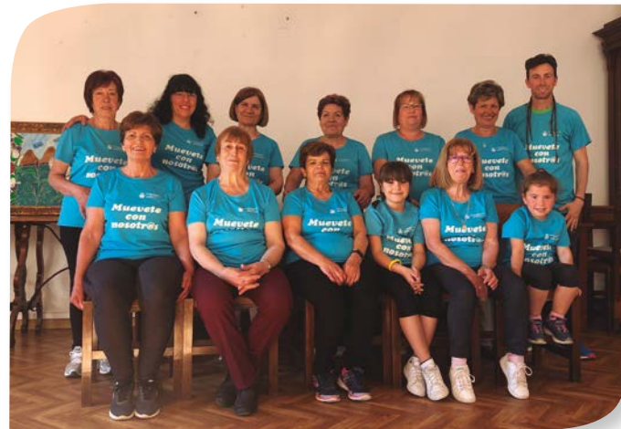
Asociación de Jubilados y Pensionistas FUENTENEbro.