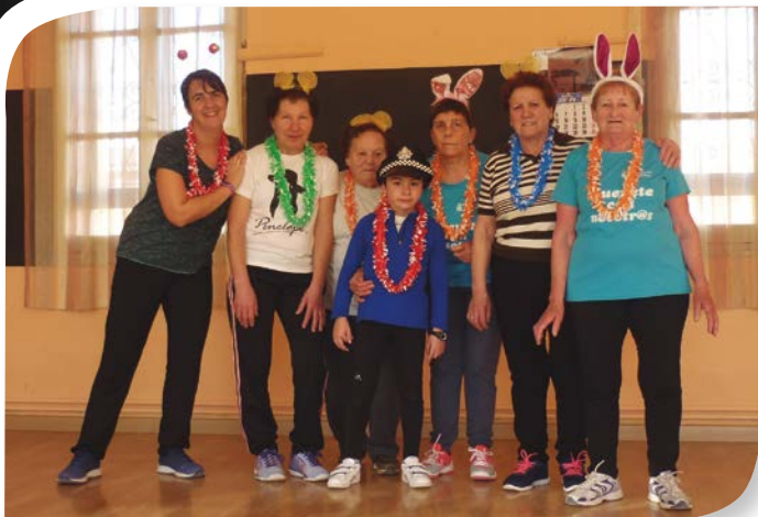
Asociación de Jubilados y Pensionistas BERLANGAS DE ROA.