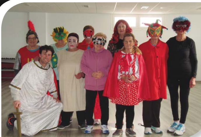
Asociación de Jubilados y Pensionistas FUENTESPINA.