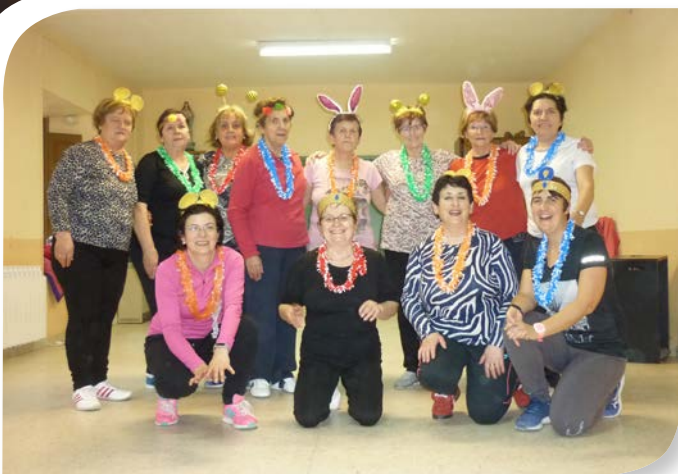
Asociación de Jubilados y Pensionistas VILLAESCUSA DE ROA.