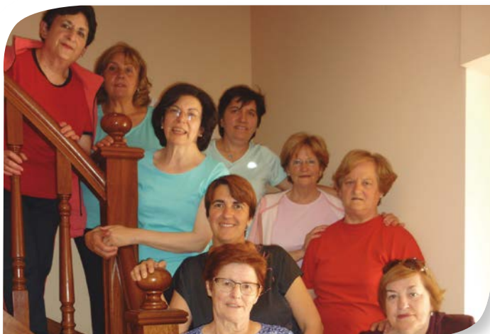
Asociación de Jubilados y Pensionistas VILLAESCUSA DE ROA.