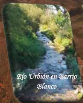
Río Urbión en Barrio Blanco

Las estrellas y la luna hicieron un guiño. El cielo lloro, lloró y lloró, tanto que sus lágrimas al río Urbión desbordó. Así fue como el fuego se apagó.