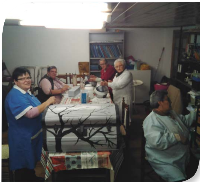
Asociación de Jubilados y Pensionistas BEORADO.